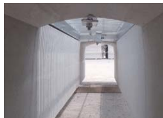
締め上げ完了状態