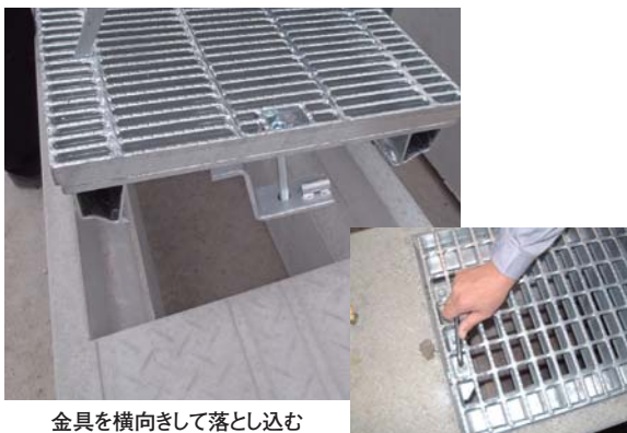
金具を横向きして落とし込む