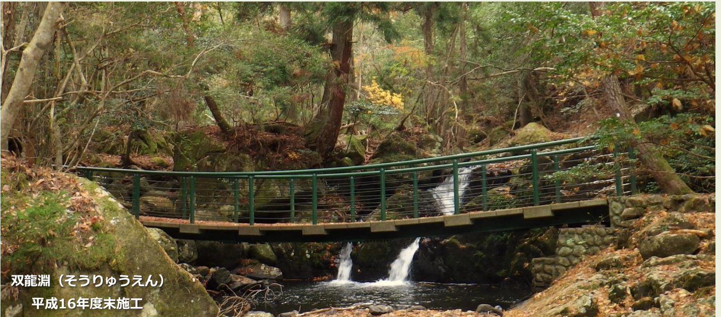
双龍淵 (そうりゅうえん) 平成16年度未施工