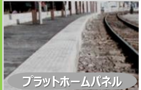
プラットホームパネル