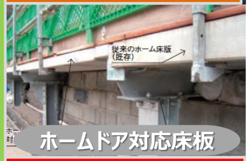
ホームドア対応床板