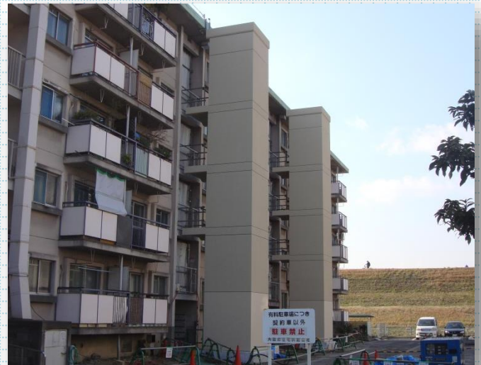
後付けエレベーターシャフト「ラクシス」設置実績