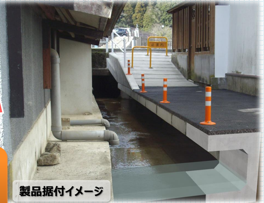
製品据付イメージ