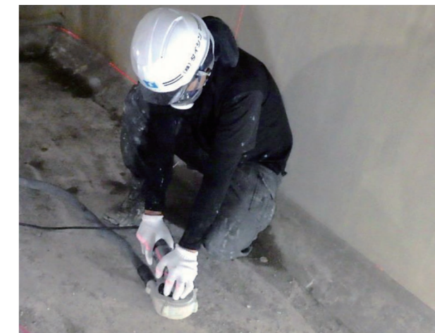
下地処理工 (ケレン工)