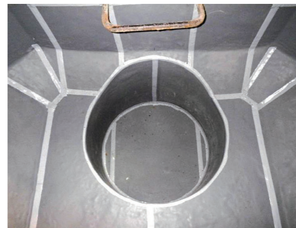
ピット部施工状況