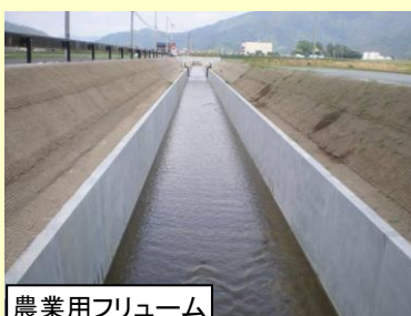
農業用フリューム