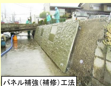
パネル補強(補修)工法