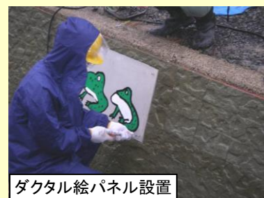
ダクトル絵パネル設置